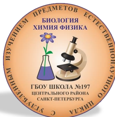
ГБОУ школа №197 Центрального района Санкт-Петербурга